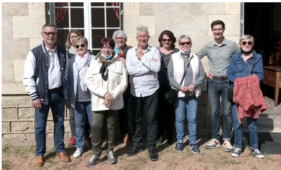
Le Conseil d'administration pilote les activités et s'entoure de nombreux bénévoles pour en assurer la réussite.

Saint-Priest-Bramefant. Le Guérinet prépare sa nouvelle saison. Comme de coutume au retour du printemps, l'association festive et artistique autour du château du Guérinet a tenu son assemblée générale statutaire au siège de l'association, 2 route de Vichy, à Saint-Priest-Bramefant.