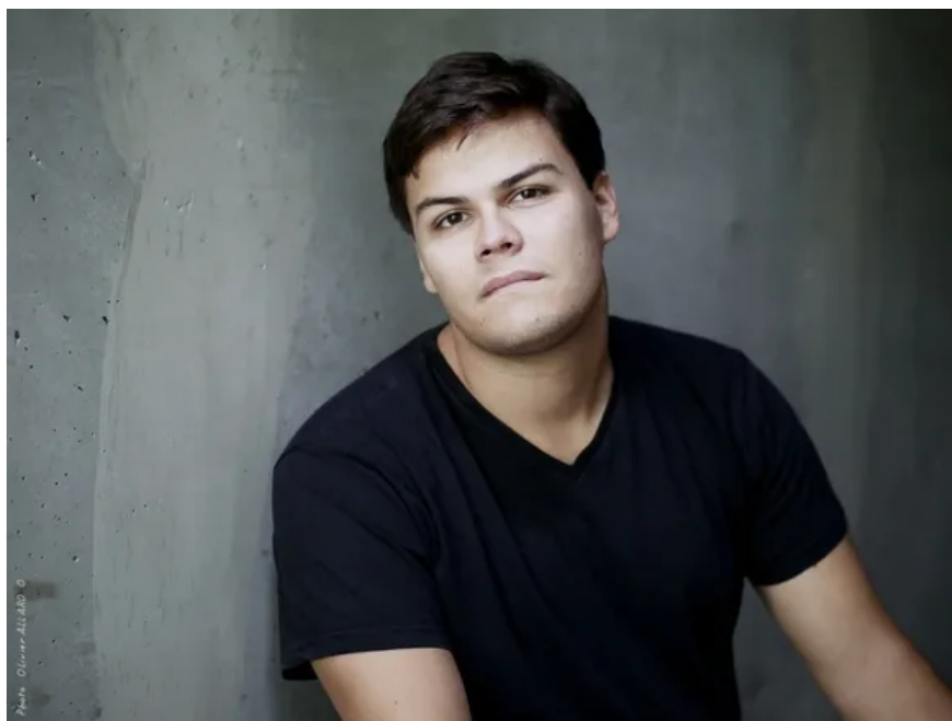
Acteur professionnel et formateur au cours Florent à Paris.

Saint-Priest-Bramefant. Molière en majesté au château du Guérinet. Pour fêter les 400 ans de Jean-Baptiste Poquelin dit Molière, un week-end d'animation lui sera dédié au château du Guérinet près de Saint-Priest-Bramefant.