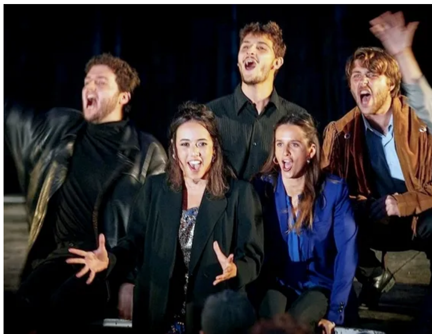
La troupe fera siennes les aventures , jeudi 28 juillet, en soirée.

Saint-Priest-Bramefant. Le festival du Guérinet démarre jeudi. Le festival du Guérinet animera le territoire de Plaine Limagne du 21 au 31 juillet. Si le centre névralgique de la manifestation restera le fameux château du Guérinet à Saint-Priest-Bramefant, le choix fait par les organisateurs pour cette 2 e édition sera l'essaimage, géographique d'abord à Randan, Aigueperse, Saint-Clément-de-Régnat, Maringues et essaimage en direction des publics variés ensuite (Ehpad, centre de loisirs, baby-concerts et ateliers).